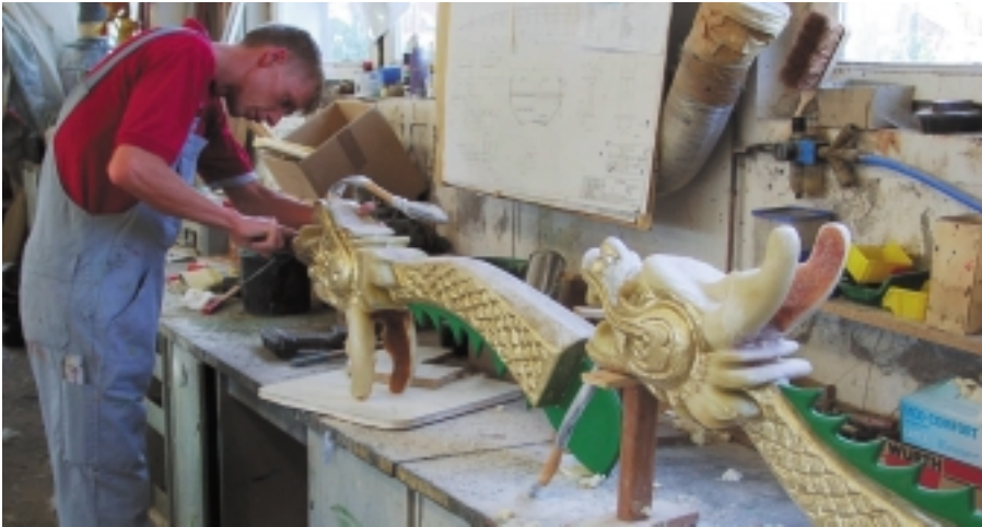
Das Gesicht bekommt das Boot natürlich erst durch den Drachenkopf. Verständlicher Weise hat jede Region ihr eigenes Design, und die Künstler können ihrer Individualität Raum geben.

Strecken über See in Kanus zurück legen, andere sehen ihren Ursprung in der malayisch-indonesischen Kultur, die sich mit der chinesischen vermischt. Denn gerade der Vortrieb durch Paddel ist für chinesische Boote untypisch. Wie dem auch sei: Die Boote sind seit langem Realität und sind aus dem Leben der Menschen in den Küstenstädten Asiens nicht mehr wegzudenken.