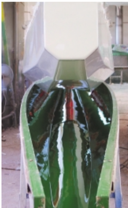
Das Entformen des Rumpfes ist im GFK-Bootsbau immer einer der spannendsten Augenblicke.

Das war am fünften Tag des fünften Mondes und so ist auch dies noch heute der Zeitpunkt, zu dem sich die Fischer jährlich treffen und auch die traditionellen Drachenboot-Rennen zu seiner Erinnerung stattfinden.