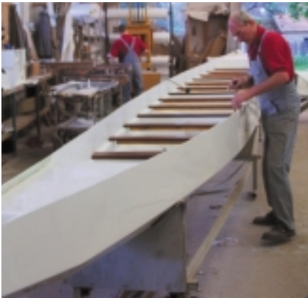
Einbau der Sitz-Duchten aus Holz in die GFK-Schale.

den. Und dies ist die zweite Erfolgsgeschichte: Inzwischen nähert man sich bei der Werft in Rastow in Mecklenburg der Baunummer 400. Es gibt, wie bei internationalen Bootsklassen üblich, auch in einigen anderen Ländern Hersteller, aber die gute Qualität der deutschen Werft hat sich weltweit herumgesprochen. So zählen inzwischen Teams aus ganz Europa, den USA, Kanada und Australien zu den Kunden. Selbst nach Wladiwostok wurden Boote geliefert. Eine besonders gut funktionierende Vertriebschiene konnte BuK in Kanada aufbauen. Von dort aus wird der gesamte nordamerikanische Markt mit Drachenbooten „made by BuK“ bedient. Aufschwung Ost durch Eigeninitiative. Einen Höhepunkt im Jahr 2001 stellte die Welt-