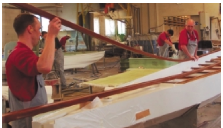
Die Balkweger geben der Rumpfschale erst die notwendige Steifigkeit im Decksbereich.

langen. Manche Forscher sind der Meinung, dass sie sich aus den Reisekanus der pazifischen Völker entwickelt haben, die bereits weite