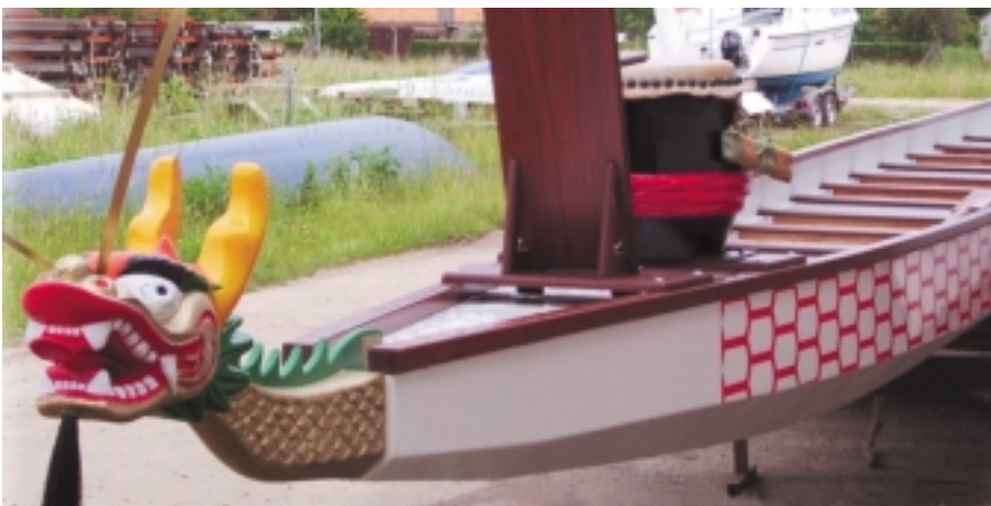
Der Drachenkopf als empfindliches Teil wird jeweils nur am Steven aufgesteckt. Vor der Lehne des Steuermanns, steht die Trommel, wichtig für den Gleichtakt der Mannschaft und harmonischen Schlägen.

Und so finden wir diese Elemente des Drachen auch beim Drachenboot wieder, mit seinem geschuppten Rumpf und einem Kopf, dessen Gestaltung unendliche Variationsmöglichkeiten bietet. Die Paddel stehen symbolisch für die Krallen.